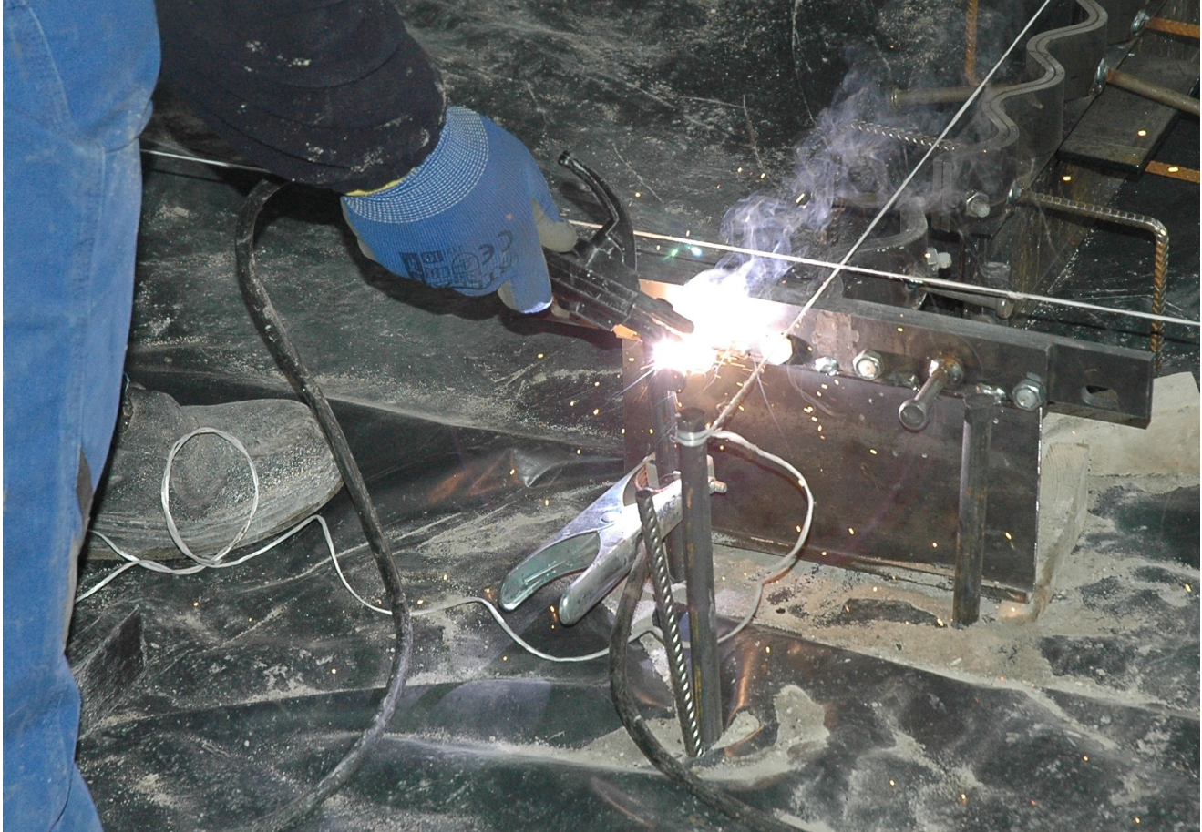
Vertikaalvarrste ühendamine profiiliga